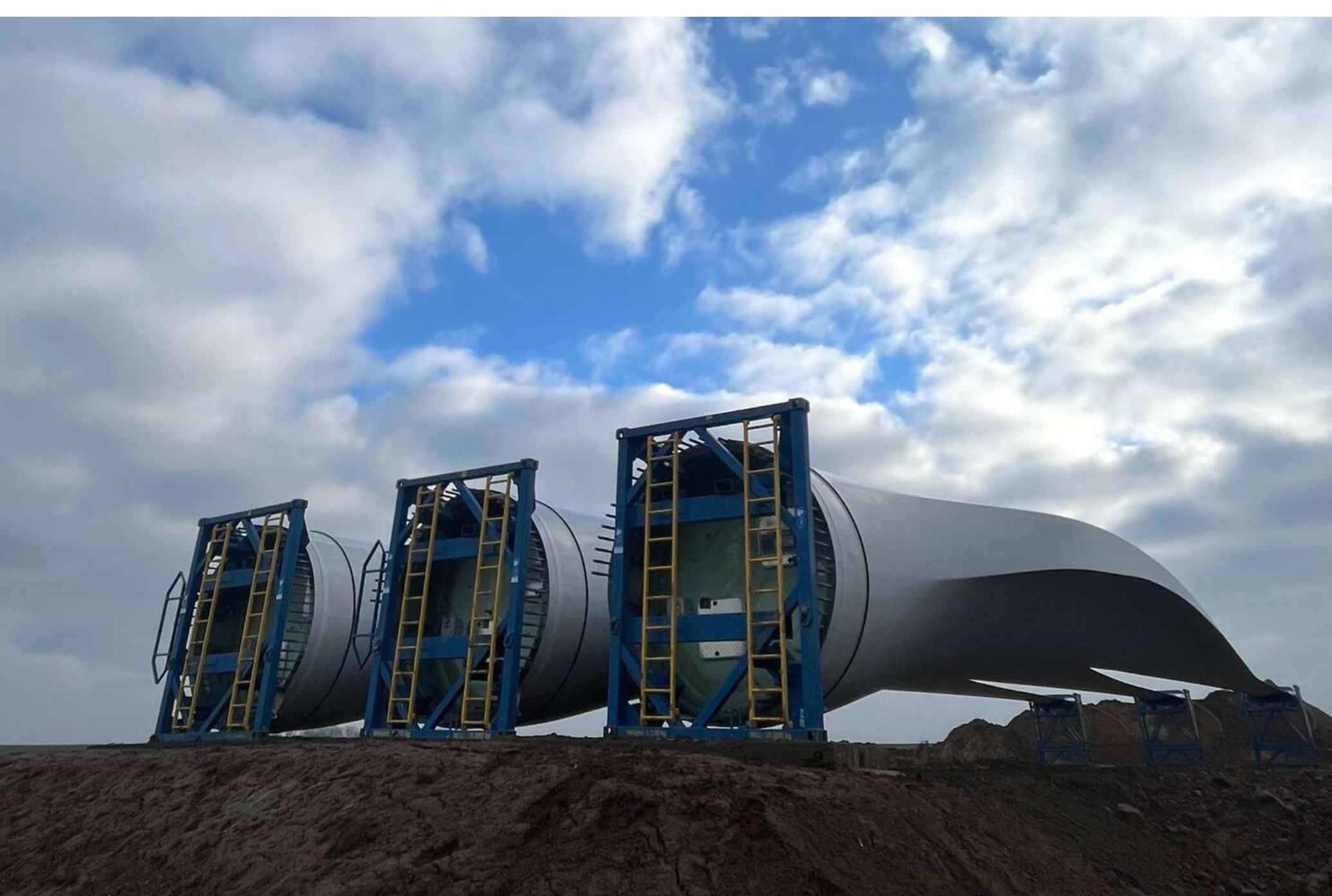
Pales installées sur leur zone de stockage.

La nacelle et les pales des éoliennes arrivent progressivement sur le chantier. Elles sont livrées à l'avance tandis que les éléments des tours arriveront mi-février, au moment du montage.