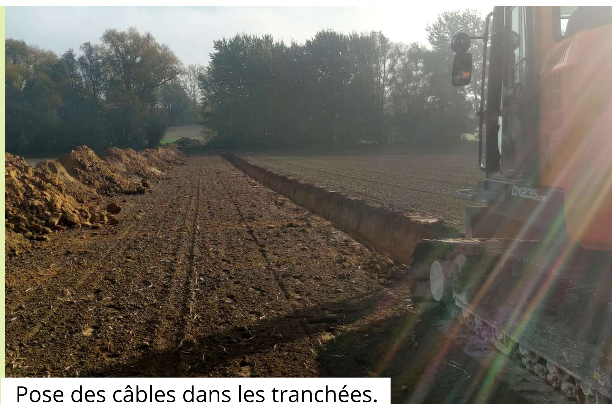
Pose des câbles dans les tranchées.

Les travaux relatifs à la pose des câbles touchent à leur fin. Le parc est désormais relié à la cabine de tête et les éoliennes seront bientôt connectées entre elles.