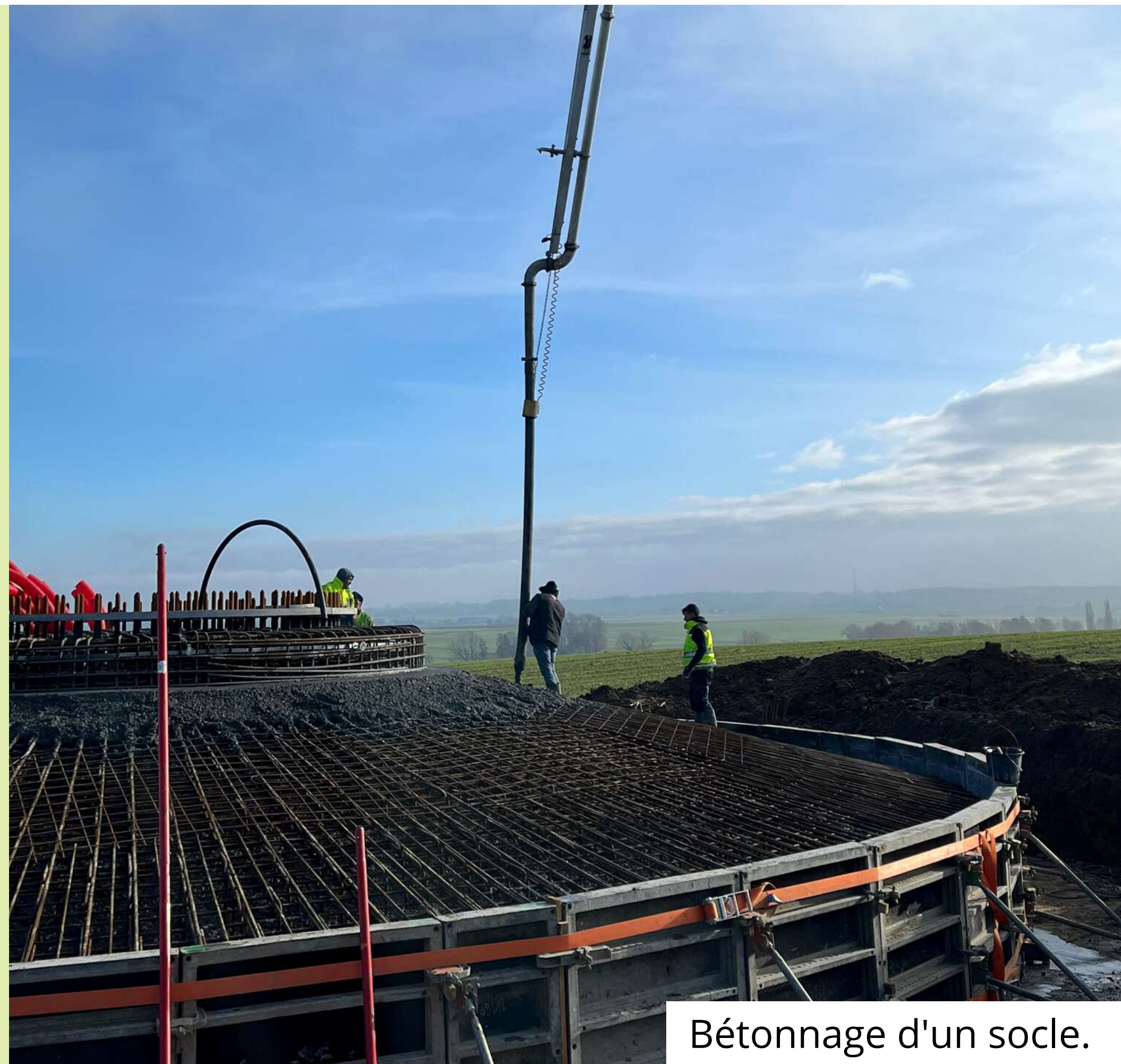
Bétonnage d'un socle.

Le ferrailage des socles est désormais terminé pour 6 éoliennes sur 8. À la fin de la semaine prochaine ces 6 socles seront bétonnés. Une fois qu'ils auront séché correctement, un remblai sera mis en place sur le dessus et le montage des pièces des éoliennes pourra enfin commencer.