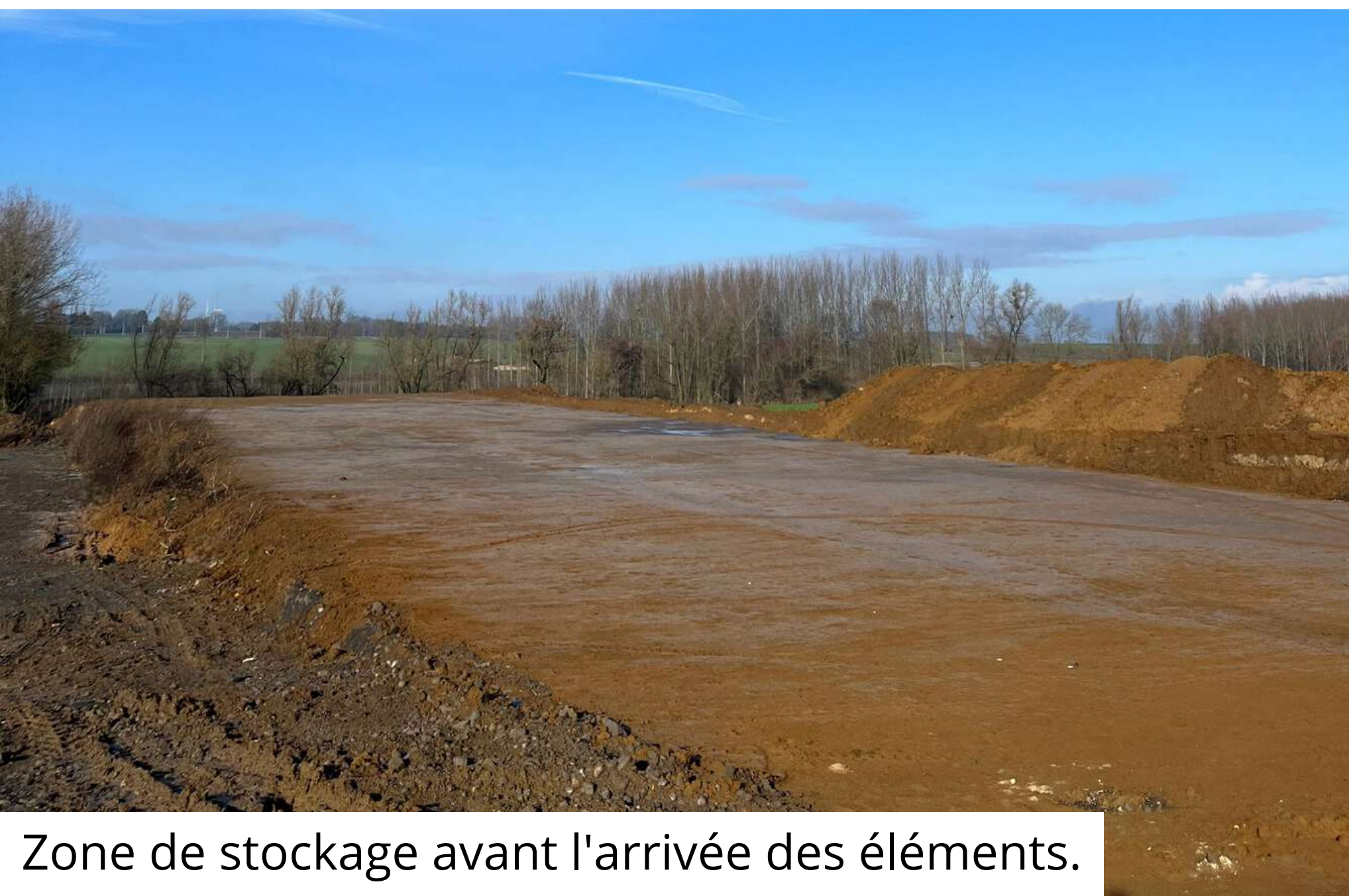
Zone de stockage avant l'arrivée des éléments.